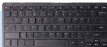
Clavier compact sans pavé numérique